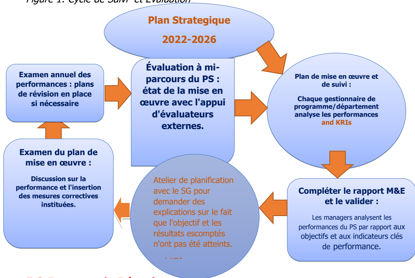
Figure 1: Cycle de Suivi et Evaluation